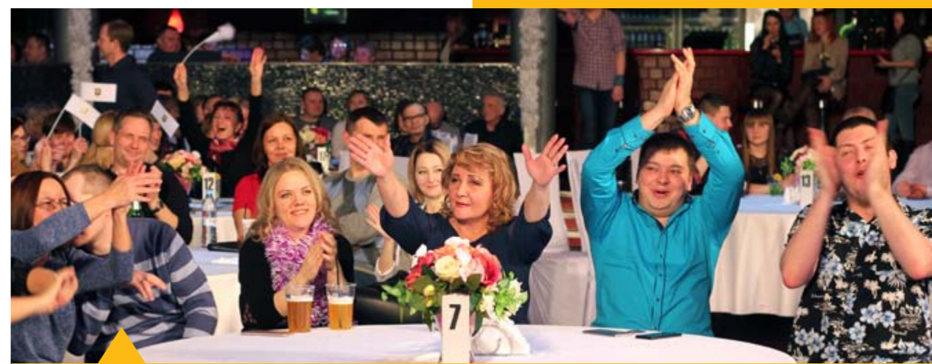
Более 400 любителей рок-музыки провели незабываемый вечер. Фото и видео в соц.сети vk/1vosgmpr