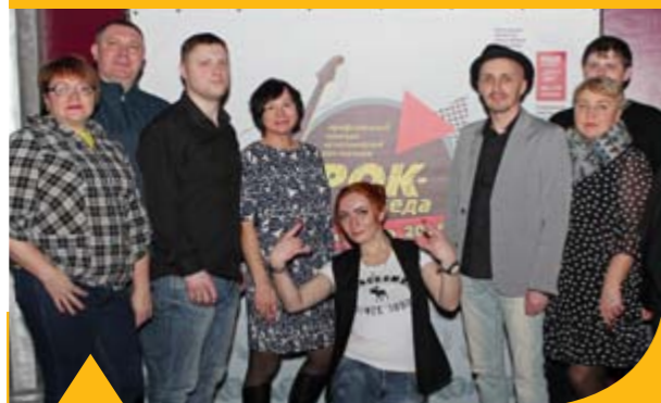
Исполнители с «Северсталь-метиза» были приняты публикой на «ура»